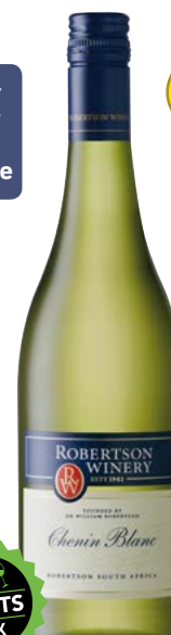
ROBERTSON CHENIN BLANC WESTERN CAPE 100% Chenin Blanc