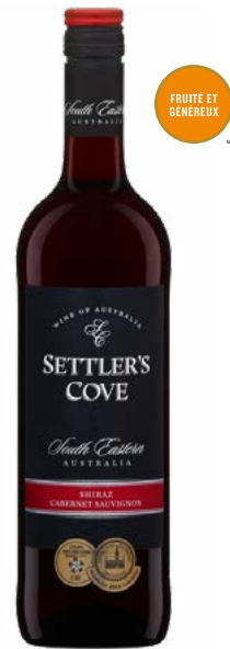
SETTLER'S COVE SHIRAZ CAB-SAUVIGNON VIN DE TABLE (VDT) 80% Shiraz, 20% Cabernet-Sauvignon