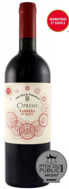
CIPRESSI "18 MOIS" BARBERA D'ASTI (DOCG) 100 % Barbera