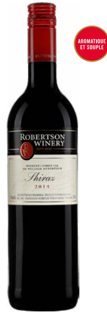
ROBERTSON SHIRAZ WESTERN CAPE 100% Shiraz