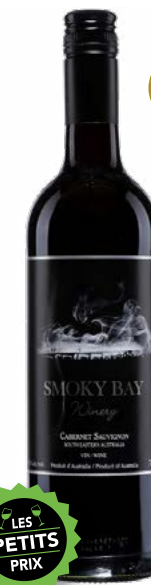
SMOKY BAY CABERNET SAUVIGNON VIN DE TABLE (VDT) 100% Cabernet-Sauvignon