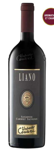
LIANO 750 ML RUBICONE (IGT) 70 % Sangiovese, 30 % Cabernet-Sauvignon