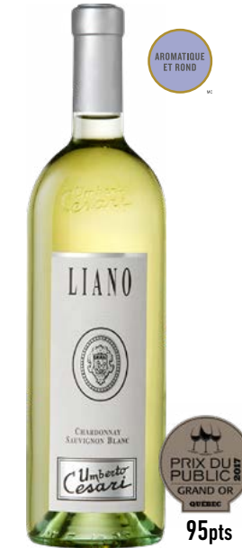
LIANO BIANCO RUBICONE (IGT) 70 % Chardonnay, 30 % Sauvignon Blanc