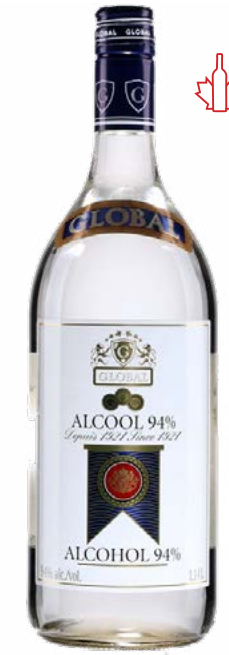
GLOBAL 94 % 1.14L ALCOOL