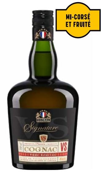
GLOBAL V.S. 750 ML COGNAC