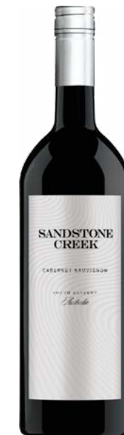
SANDSTONE CREEK 1L 100% Cabernet-Sauvignon