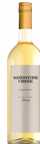
SANDSTONE CREEK 1L 100% Chardonnay