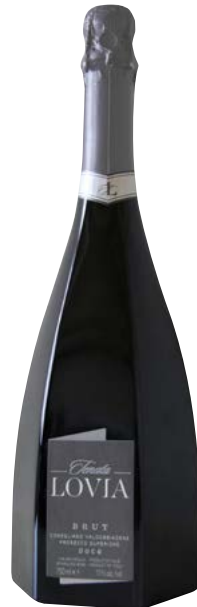
TENUTA LOVIA PROSECCO SUPERIORE BRUT (DOCG) 100 % Glera