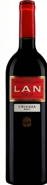
LAN CRIANZA RIOJA (DOCA) 100 % Tempranillo