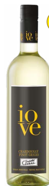
IOVE CHARDONNAY PINOT GRIGIO RUBICONE (IGT) 80 % Chardonnay, 20 % Pinot Grigio