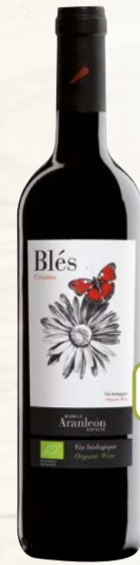
BLÉS CRIANZA VALENCIA (DO) Monastrell, Cabernet-Sauvignon