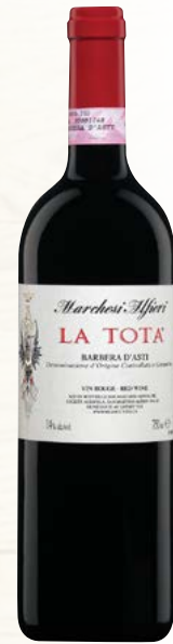
LA TOTA BARBERA D'ASTI (DOCG) 100 % Barbera