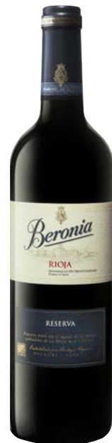
BERONIA RESERVA RIOJA (DOCA) 89 % Tempranillo, 6 % Mazuelo, 5 % Graciano