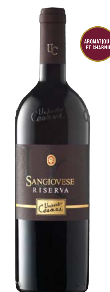
SANGIOVESE RISERVA SANGIOVESE DI ROMAGNA RISERVA (DOC) 100 % Sangiovese