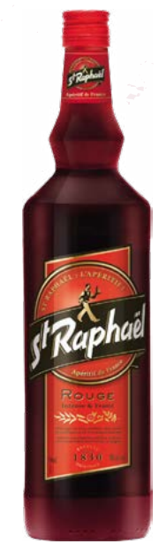
ST-RAPHAËL ROUGE APÉRITIF À BASE DE VIN