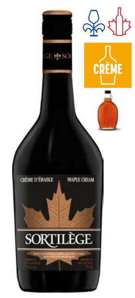
SORTILÈGE CRÈME D'ÉRABLE. 750ML BOISSON À LA CRÈME D'ÉRABLE