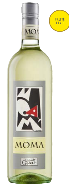
MOMA BIANCO RUBICONE (IGT) 40 % Trebbiano, 30 % Sauvignon, 30 % Chardonnay