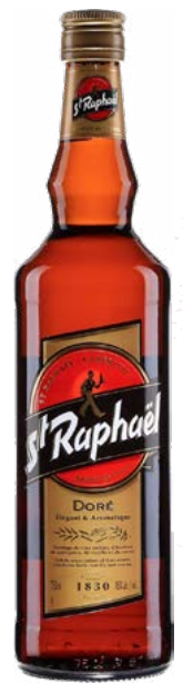
ST-RAPHAËL DORÉ APÉRITIF À BASE DE VIN