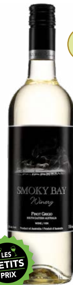
SMOKY BAY PINOT GRIGIO VIN DE TABLE (VDT) 100% Pinot Grigio