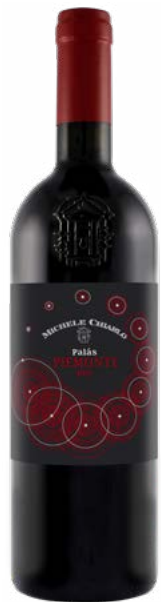
PALÀS PIEMONTE PIEMONTE (DOC)