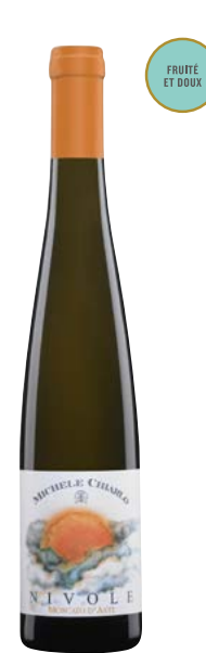
NIVOLE 375 ML MOSCATO D'ASTI (DOCG) 100 % Muscat