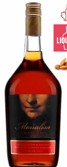
MONALISA AMARETTO 1.14 L LIQUEUR D'AMANDE ET NOYAU