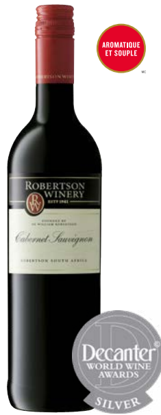
ROBERTSON CAB.-SAUV, WESTERN CAPE 100% Cabernet-Sauvignon