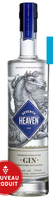
SEVENTH HEAVEN 750 ML DRY GIN