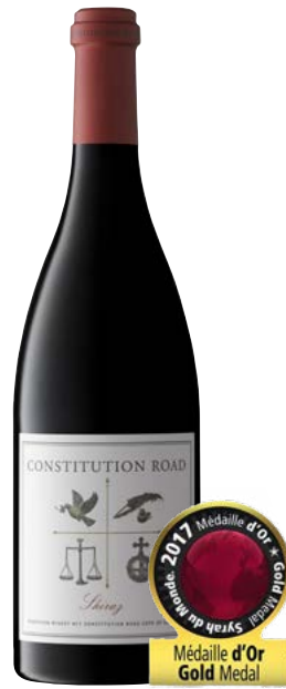
ROBERTSON CONSTITUTION ROAD SHIRAZ WESTERN CAPE 100% Shiraz