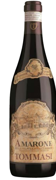
AMARONE VALPOLICELLA (DOC) 65 % Corvina 30 % Rondinella 5 % Molinara