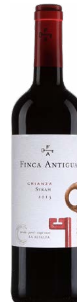
FINCA ANTIGUA SYRAH LA MANCHA (DO) 100 % Syrah