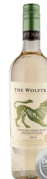
THE WOLFTRAP WHITE WESTERN CAPE 57 % Viognier, 32 % Chenin Blanc, 11 % Grenache Blanc