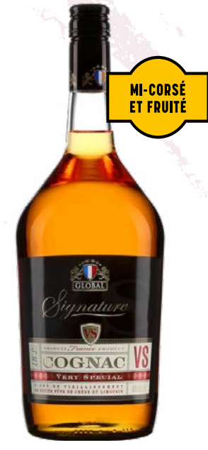
GLOBAL V.S. 1.14 L COGNAC