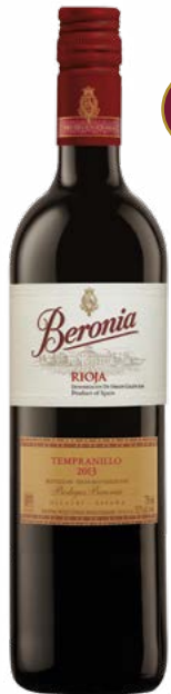
BERONIA TEMPRANILLO RIOJA (DOCA) 100 % Tempranillo