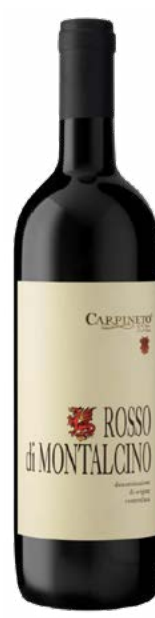
CARPINETO ROSSO DI MONTALCINO (DOC) 100 % Sangiovese