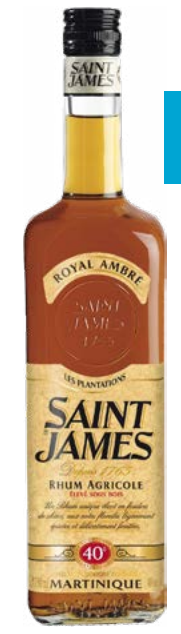
SAINT JAMES ROYAL AMBRÉ RHUM AGRICOLE