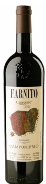
FARNITO CAMPONIBBIO 50 % Sangiovese, 30 % Cabernet-Sauvignon, 20 % Merlot