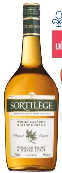
SORTILÈGE 750ML LIQUEUR DE WHISKY CANADIEN ET SIROP D'ÉRABLE