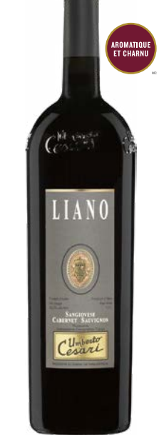
LIANO 1,5 L RUBICONE (IGT) 70 % Sangiovese, 30 % Cabernet-Sauvignon