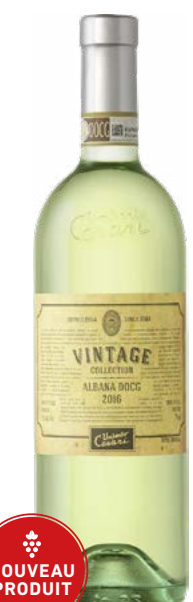
VINTAGE COLLECTION ALBANA (DOCG) 100 % Albana