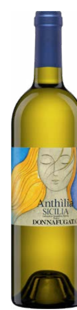
DONNAFUGATA ANTHILIA SICILIA (DOC) 75 % Catarratto 15 % Ansonica 10 % Grillo