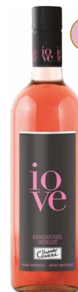
IOVE ROSÉ RUBICONE (IGT) 80 % Sangiovese, 20 % Merlot