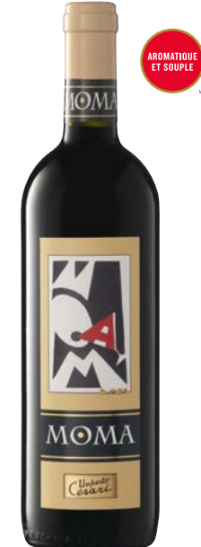
MOMA ROSSO RUBICONE (IGT) 80 % Sangiovese, 10 % Cabernet-Sauvignon, 10 % Merlot