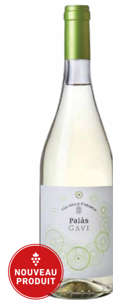
PALÀS GAVI GAVI (DOCG) 100 % Cortese