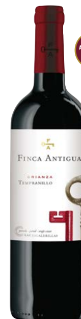
FINCA ANTIGUA TEMPRANILLO LA MANCHA (DO) 100 % Tempranillo