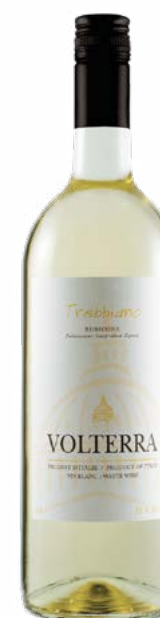
VOLTERRA TREBBIANO 1L 100 % Trebbiano