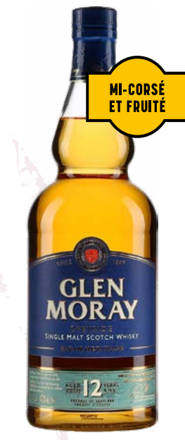
GLEN MORAY 12 ANS SCOTCH SINGLE MALT WHISKY ÉCOSSAIS