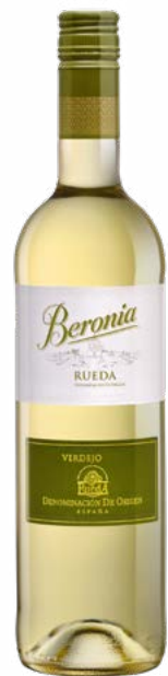
BERONIA RUEDA RUEDA (DO) 100 % Verdejo