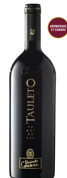
TAULETO RUBICONE (IGT) 90 % Sangiovese 10 % Bursona Longanesi