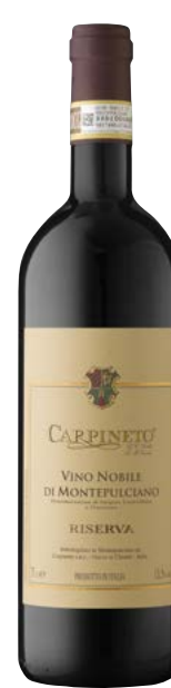
VINO NOBILE DI MONTEPULCIANO RISERVA TOSCANA (DOCG) 70 % Sangiovese, 30 % Canaiolo