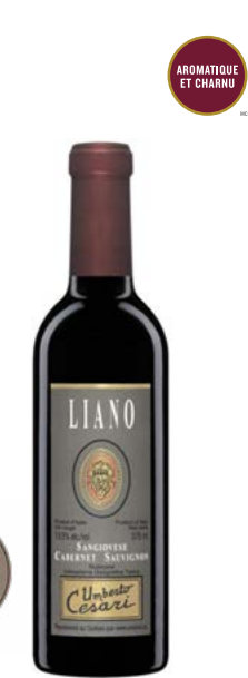
LIANO 375 ML RUBICONE (IGT) 70 % Sangiovese, 30 % Cabernet-Sauvignon