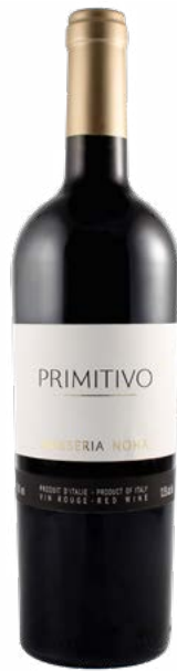
MASSERIA NOHA PRIMITIVO SALENTO (IGP) 100 % Primitivo