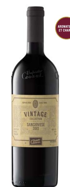
VINTAGE COLLECTION SANGIOVESE RISERVA (DOC) 100 % Sangiovese