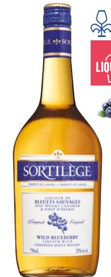
SORTILÈGE LIQUEUR DE BLEUETS SAUVAGES 750 ML LIQUEUR DE BLEUETS SAUVAGES AVEC WHISKY CANADIEN & SIROP D'ÉRABLE