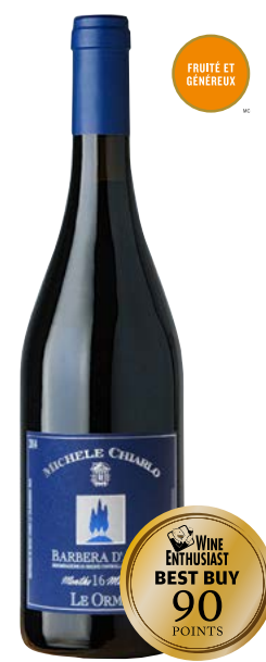
LE ORME "16 MOIS" BARBERA D'ASTI (DOCG) 100 % Barbera