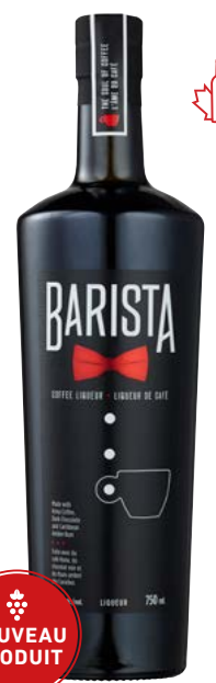
BARISTA 750 ML LIQUEUR DE CAFÉ