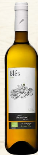
BLÉS BLANCO VALENCIA (DO) 60 % Macabeo, 40 % Sauvignon Blanc