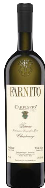
FARNITO CHARDONNAY TOSCANA (IGT) 100 % Chardonnay