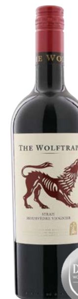
THE WOLFTRAP WESTERN CAPE 65 % Syrah, 32 % Mourvèdre, 3 % Viognier