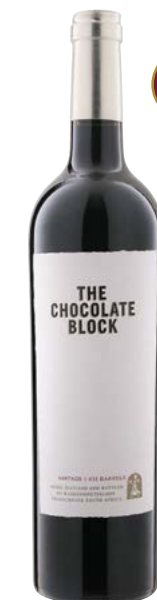
THE CHOCOLATE BLOCK SWARTLAND 79 % Syrah, 11 % Grenache, 13 % Cabernet-Sauvignon, 3 % Cinsault, 1 % Viognier