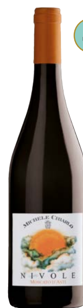
NIVOLE 750 ML MOSCATO D'ASTI (DOCG) 100 % Muscat