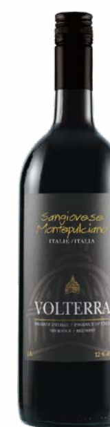
VOLTERRA SANGIOVESE MONTEPULCIANO 1L 100 % Sangiovese