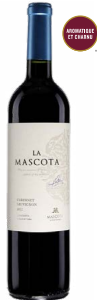
LA MASCOTA CABERNET SAUVIGNON VINO DE MESA 100% Cabernet-Sauvignon