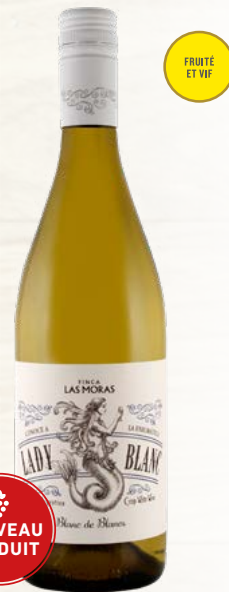
LADY BLANC BLANC DE BLANCS 40% Chenin Blanc, 30% Trebbiano, 30% Pinot Grigio