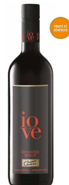
IOVE SANGIOVESE MERLOT RUBICONE (IGT) 80 % Sangiovese, 20 % Merlot