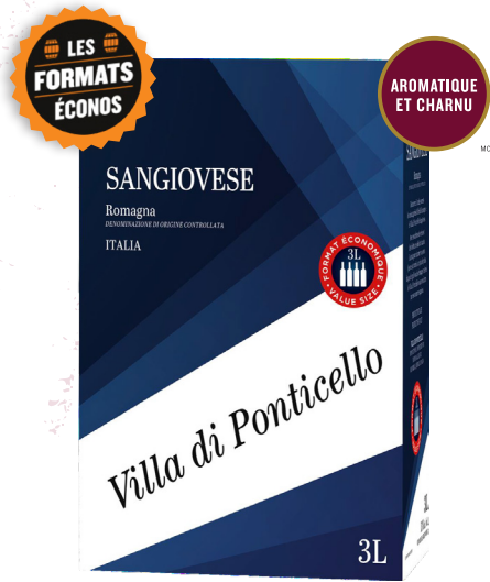
VILLA DI PONTICELLO SANGIOVESE, 3L DELLE-VENEZIE 100 % Sangiovese