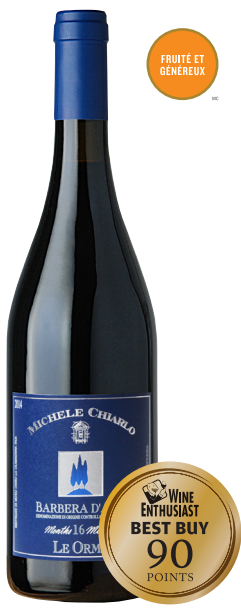
LE ORME "16 MOIS" BARBERA D'ASTI (DOCG) 100 % Barbera