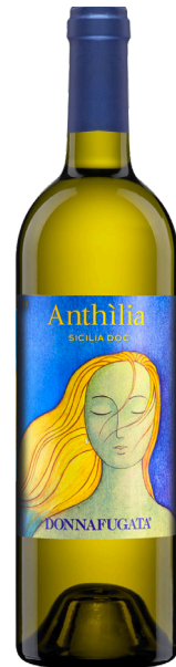
DONNAFUGATA ANTHILIA SICILIA (DOC)

75 % CATARRATTO 15 % ANSONICA 10 % GRILLO