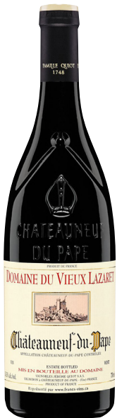
DOMAINE DU VIEUX LAZARET CHÂTEAUNEUF-DU-PAPE (AOC)

60 % Grenache 25 % Syrah, 10 % Mourvèdre, 5 % Cinsault