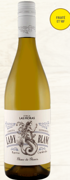
LADY BLANC BLANC DE BLANCS 40% Chenin Blanc, 30% Trebbiano, 30% Pinot Grigio