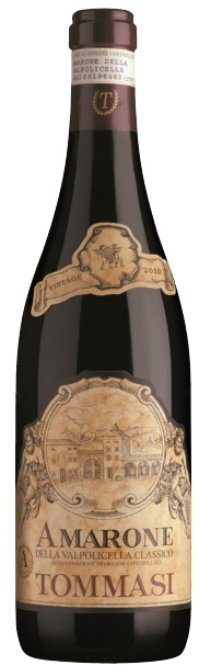
AMARONE VALPOLICELLA (DOC) 65 % Corvina 30 % Rondinella 5 % Molinara