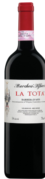
LA TOTA BARBERA D'ASTI (DOCG) 100 % Barbera