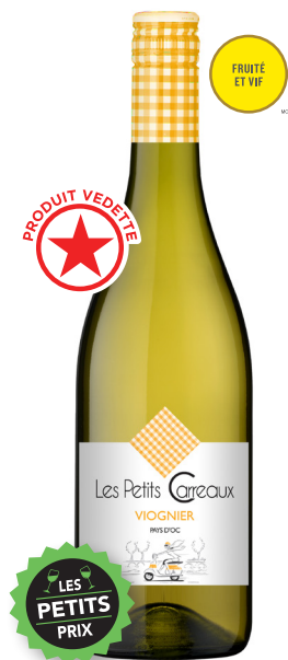
LES PETITS CARREAUX VIOGNIER PAYS D'OC 100 % Viognier