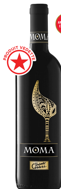
MOMA ROSSO RUBICONE (IGT) 80 % Sangiovese, 10 % Cabernet-Sauvignon, 10 % Merlot