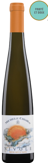
NIVOLE 375 ML MOSCATO D'ASTI (DOCG) 100 % Muscat