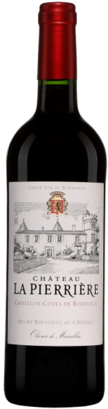
CHÂTEAU LA PIERRIÈRE CASTILLON CÔTES DE BORDEAUX 2017

MERLOT 80 %, CABERNET FRANC 15 %, CABERNET-SAUVIGNON 5 %