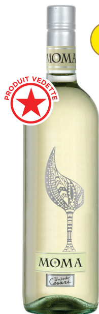
MOMA BIANCO RUBICONE (IGT) 40 % Trebbiano, 30 % Sauvignon, 30 % Chardonnay