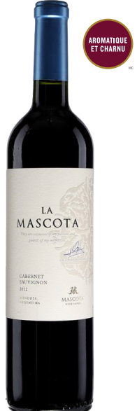
LA MASCOTA CABERNET SAUVIGNON VINO DE MESA 100% Cabernet-Sauvignon