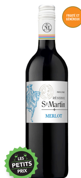
MERLOT RÉSERVE SAINT-MARTIN PAYS D'OC 100 % Merlot