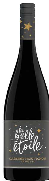
LA BELLE ÉTOILE LUSSAC-SAINT-EMILION Cabernet-sauvignon