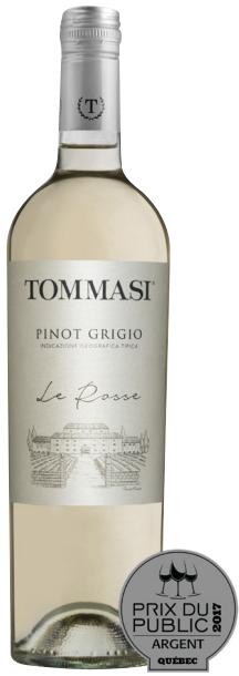
LE ROSSE PINOT GRIGIO TREVENEZIE (DOC) 100 % Pinot Grigio