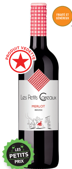
LES PETITS CARREAUX MERLOT PAYS D'OC 100 % Merlot