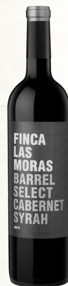
FINCA LAS MORAS BARREL SELECT CABERNET SYRAH 50% Cab.-sauvignon, 50% Syrah