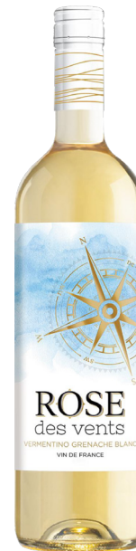
ROSE DES VENTS LUSSAC-SAINT-EMILION Vermentino 75%, Grenache Blanc 25%