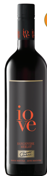
IOVE SANGIOVESE MERLOT RUBICONE (IGT) 80 % Sangiovese, 20 % Merlot