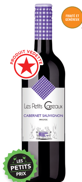
LES PETITS CARREAUX CABERNET-SAUVIGNON PAYS D'OC 100 % Cabernet-Sauvignon