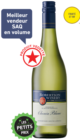
ROBERTSON CHENIN BLANC WESTERN CAPE 100% Chenin Blanc