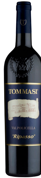
RIPASSO VALPOLICELLA RIPASSO (DOC) 70 % Corvina 20 % Rondinella 10 % Molinara