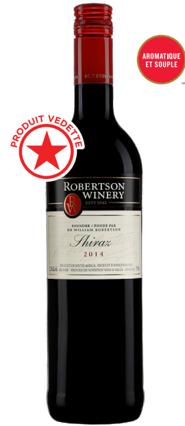
ROBERTSON SHIRAZ WESTERN CAPE 100% Shiraz