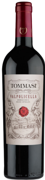
VALPOLICELLA VALPOLICELLA (DOC) 60 % Corvina 30 % Rondinella 10 % Molinara