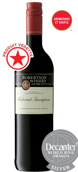
ROBERTSON CAB.-SAUV, WESTERN CAPE 100% Cabernet-Sauvignon