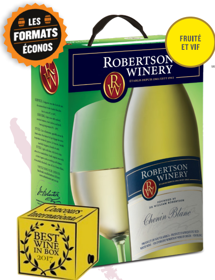
CHENIN BLANC, 3L WESTERN CAPE 100% Chenin Blanc