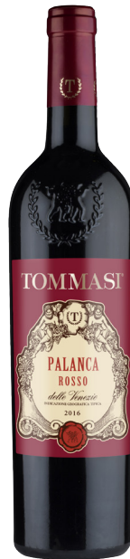
PALANCA ROSSO TREVENEZIE (IGT) 60 % Corvina 30 % Rondinella 10 % Merlot