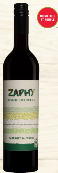
TRAPICHE ZAPHY CABERNET SAUVIGNON MENDOZA MENDOZA 100% Cabernet-Sauvignon