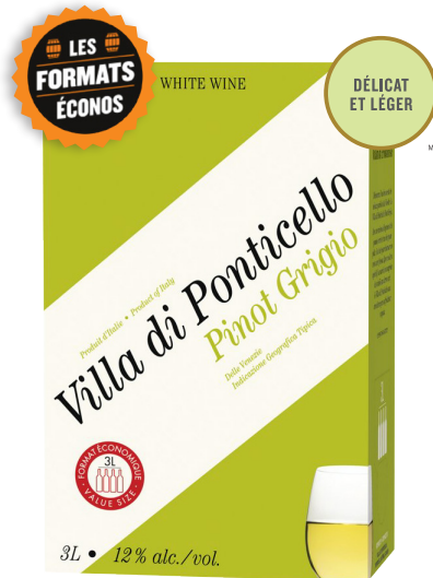
VILLA DI PONTICELLO PINOT GRIGIO, 3L DELLE-VENEZIE 100 % Pinot Grigio