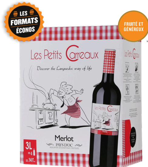
LES PETITS CARREAUX, 3L WESTERN CAPE 100% Merlot