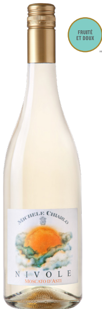
NIVOLE 750 ML MOSCATO D'ASTI (DOCG) 100 % Muscat