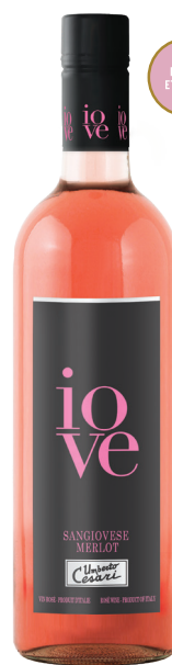
IOVE ROSÉ RUBICONE (IGT) 80 % Sangiovese, 20 % Merlot