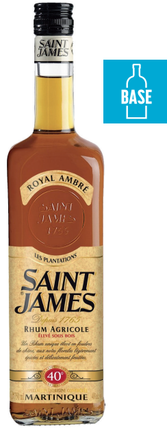
SAINT JAMES ROYAL AMBRÉ RHUM AGRICOLE