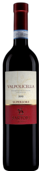
SARTORI VALPOLICELLA SUPERIORE 45% Corvina Veronese 30% Corvinone Veronese 20% Rondinella 5% Croatina