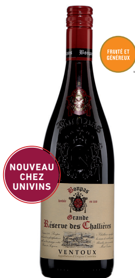
BONPAS GRANDE RÉSERVE DES CHALLIÈRES VENTOUX VALLÉE DU RHÔNE