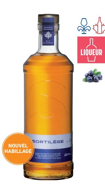
SORTILÈGE LIQUEUR DE BLEUETS SAUVAGES 750 ML LIQUEUR DE BLEUETS SAUVAGES AVEC WHISKY CANADIEN & SIROP D'ÉRABLE