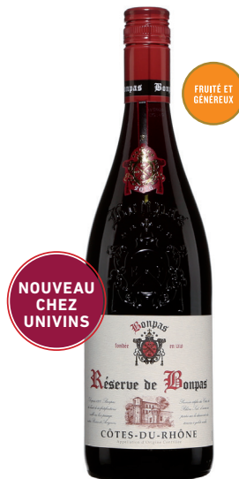
BONPAS GRANDE RÉSERVE DES CHALLIÈRES CÔTES DU RHÔNE CÔTES DU RHÔNE

GRENACHE 60 %, SYRAH 30 %, MOURVÈDRE 10 %