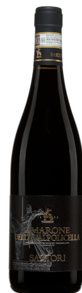
SARTORI AMARONE DELLA VALPOLICELLA 70% Corvina Veronese 15% Rondinella 10% Molinara 5% autre variété