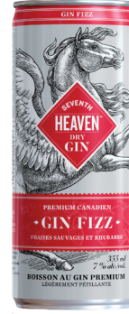
SEVENTH HEAVEN GIN FIZZ FRAISE ET RHUBARBE, 4 X 355ML GIN