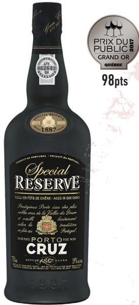
CRUZ SPECIAL RESERVE PORTO