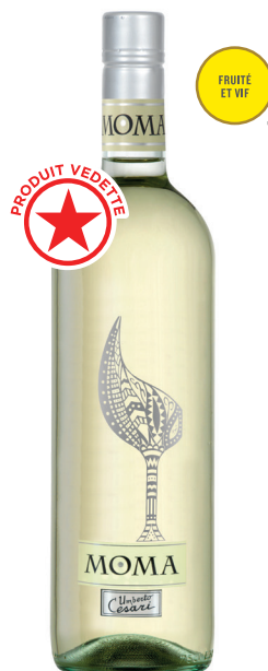
MOMA BIANCO RUBICONE (IGT) 40 % Trebbiano, 30 % Sauvignon, 30 % Chardonnay