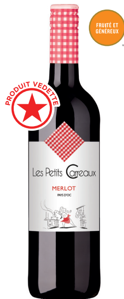
LES PETITS CARREAUX MERLOT PAYS D'OC 100 % Merlot