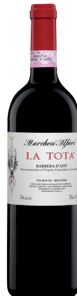
LA TOTA BARBERA D'ASTI (DOCG) 100 % Barbera