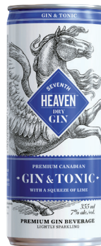
SEVENTH HEAVEN GIN & TONIC 4 X 355ML GIN