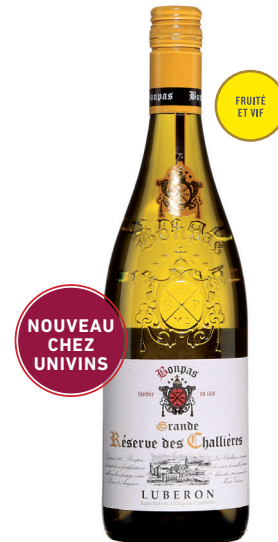
BONPAS GRANDE RÉSERVE DES CHALLIÈRES LUBERON VALLÉE DU RHÔNE

CLAIRETTE 25 %, GRENACHE 25 %, UGNI BLANC 25 %, VERMENTINO 25 %