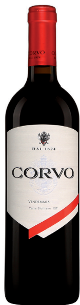
CORVO TERRE SICILIANE 50% Nero d'Avola 50% Merlot