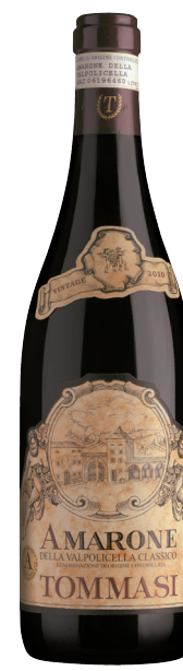
AMARONE VALPOLICELLA (DOC) 65 % Corvina 30 % Rondinella 5 % Molinara