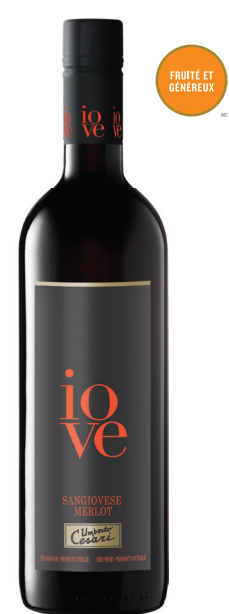
IOVE SANGIOVESE MERLOT RUBICONE (IGT) 80 % Sangiovese, 20 % Merlot