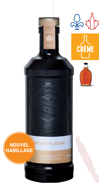
SORTILÈGE CRÈME D'ÉRABLE. 750ML BOISSON À LA CRÈME D'ÉRABLE