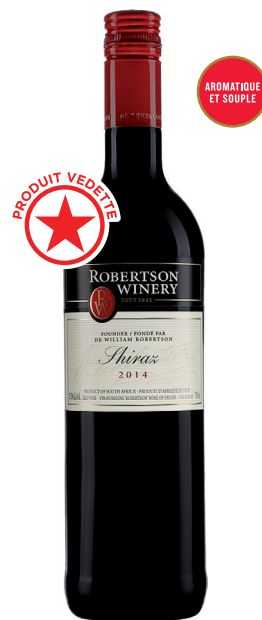
ROBERTSON SHIRAZ WESTERN CAPE 100% Shiraz