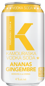
KAMOURASKA SELTZER ANANAS ET GINGEMBRE 6 X 355ML VODKA