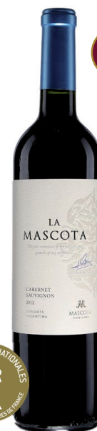
LA MASCOTA CABERNET SAUVIGNON VINO DE MESA 100 % Cabernet-Sauvignon