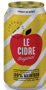
LE CIDRE ORIGINAL VERGER HEMMINGFORD CIDRE PÉTILLANT, 355 ML