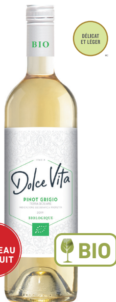
DOLCE VITA PINOT GRIGIO TERRE SICILIANE 100 % Pinot Grigio