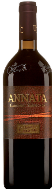
ANNATA CABERNET-SAUVIGNON 100 % Cabernet-Sauvignon