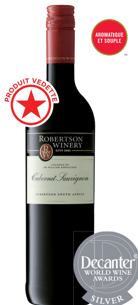
ROBERTSON CAB,-SAUV, WESTERN CAPE 100% Cabernet-Sauvignon