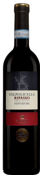
SARTORI RIPASSO VALPOLICELLA SUPERIORE 45% Corvina Veronese 30% Corvinone 20% Rondinella 5% Croatina