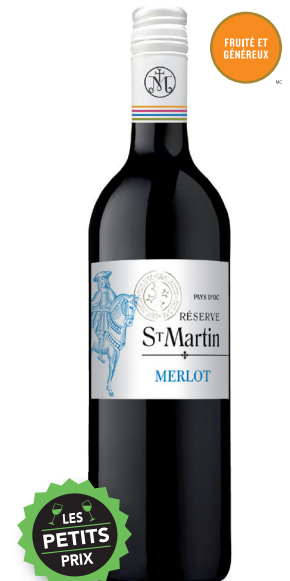
MERLOT RÉSERVE SAINT-MARTIN PAYS D'OC 100 % Merlot