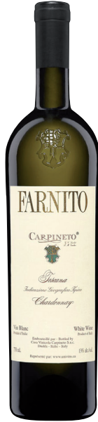
FARNITO CHARDONNAY TOSCANA (IGT) 100 % Chardonnay