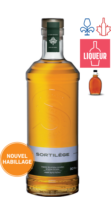
SORTILÈGE 750ML LIQUEUR DE WHISKY CANADIEN ET SIROP D'ÉRABLE