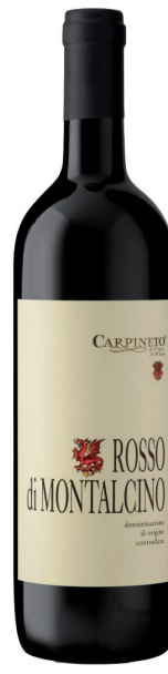
CARPINETO ROSSO DI MONTALCINO (DOC) 100 % Sangiovese