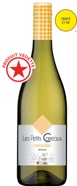
LES PETITS CARREAUX VIOGNIER PAYS D'OC 100 % Viognier