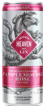
SEVENTH HEAVEN GIN FIZZ PAMPLEMOUSSE 4 X 355ML GIN