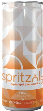
VERGER HEMMINGFORD SPRITZOL 0.5 CIDRE PÉTILLANT, 250 ML