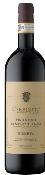
VINO NOBILE DI MONTEPULCIANO RISERVA TOSCANA (DOCG) 70 % Sangiovese, 30 % Canaiolo