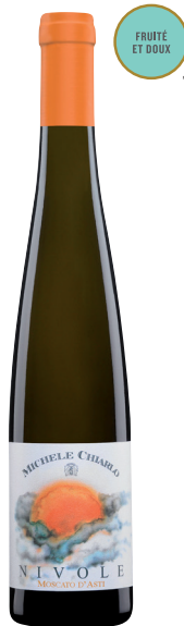
NIVOLE 375 ML MOSCATO D'ASTI (DOCG) 100 % Muscat