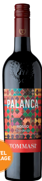
PALANCA ROSSO TREVENEZIE (IGT) 60 % Corvina 30 % Rondinella 10 % Merlot