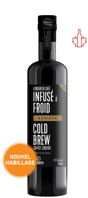
BARISTA 750 ML LIQUEUR DE CAFÉ