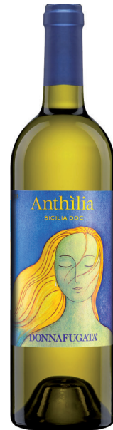
DONNAFUGATA ANTHILIA SICILIA (DOC)

75 % CATARRATTO 15 % ANSONICA 10 % GRILLO