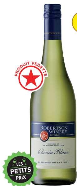
ROBERTSON CHENIN BLANC WESTERN CAPE 100% Chenin Blanc