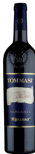
RIPASSO VALPOLICELLA RIPASSO (DOC) 70 % Corvina 20 % Rondinella 10 % Molinara