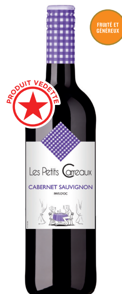
LES PETITS CARREAUX CABERNET-SAUVIGNON PAYS D'OC 100 % Cabernet-Sauvignon