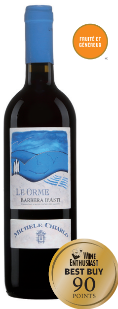
LE ORME "16 MOIS" BARBERA D'ASTI (DOCG) 100 % Barbera