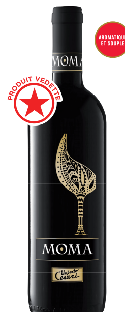
MOMA ROSSO RUBICONE (IGT) 80 % Sangiovese, 10 % Cabernet-Sauvignon, 10 % Merlot