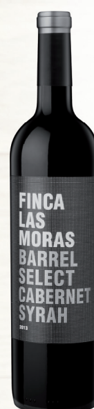
FINCA LAS MORAS BARREL SELECT CABERNET SYRAH 50 % Cab,-sauvignon, 50 % Syrah