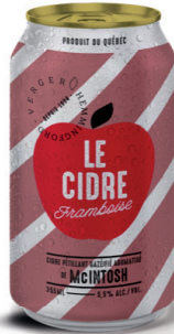
LE CIDRE FRAMBOISE VERGER HEMMINGFORD CIDRE PÉTILLANT, 355 ML