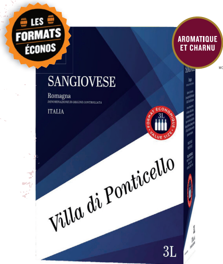
VILLA DI PONTICELLO SANGIOVESE, 3L DELLE-VENEZIE 100 % Sangiovese