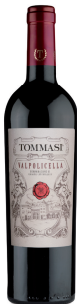
VALPOLICELLA VALPOLICELLA (DOC) 60 % Corvina 30 % Rondinella 10 % Molinara