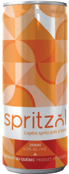
QCCIDRE SPRITZOL CIDRE PÉTILLANT, 250 ML