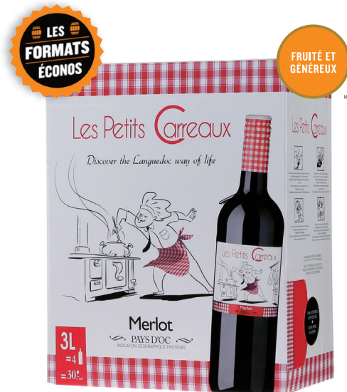
LES PETITS CARREAUX, 3L WESTERN CAPE 100% Merlot