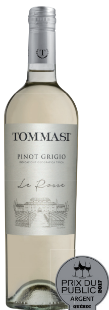
LE ROSSE PINOT GRIGIO TREVENEZIE (DOC) 100 % Pinot Grigio