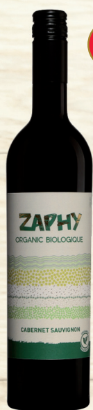
TRAPICHE ZAPHY CABERNET SAUVIGNON MENDOZA MENDOZA 100 % Cabernet-Sauvignon