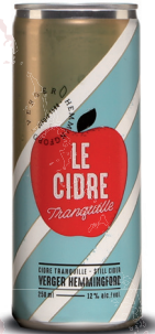
LE CIDRE TRANQUILLE VERGER HEMMINGFORD CIDRE TRANQUILLE, 250 ML