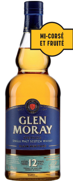
GLEN MORAY 12 ANS SCOTCH SINGLE MALT WHISKY ÉCOSSAIS