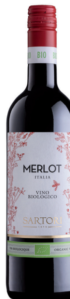
SARTORI MERLOT 100% merlot