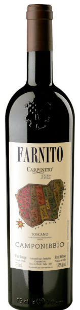
FARNITO CAMPONIBBIO 50 % Sangiovese, 30 % Cabernet-Sauvignon, 20 % Merlot